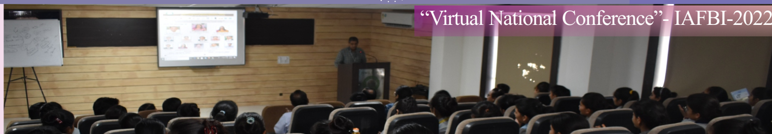
“Virtual National Conference” - IAFBI-2022

The University Lal Bahadur Shastri Chair” Faculty of Agriculture & Veterinary Science organized two days “Virtual National Conference” on “Innovations in Agriculture, Food and Biotechnology for Sustainable Income of Rural Community (IAFBI-2022)” on April 28-29, 2022 with an aim to serve the best virtual conference networking experience to share research work in form of Integration & Correlation based papers.